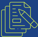
Table de matières